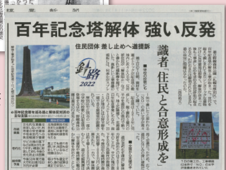
②読売新聞（平成4年11月13日）。読売新聞は記念塔解体に疑義のあることを大きく取り上げた