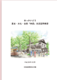
①解体を決めた「空間構想」表紙

解体を具体的に決めたのは、平成30年12月の「ほっかいどう歴史・文化・自然『体感』交流空間構想」という北海道百年事業で整備された「北海道百年記念塔」「野幌森林公園」「北海道博物館」「開拓の村」の今後のあり方を定めた計画です。このなかで記念塔は「今後の老朽化の進展を完全に防ぐことは困難」「利用者の安全確保や将来世代への負担軽減等の観点から、解体もやむを得ない」とされました。その後、道議会にこの構想の報告がなされましたが、記念塔解体が単独で議決されたことはありません。