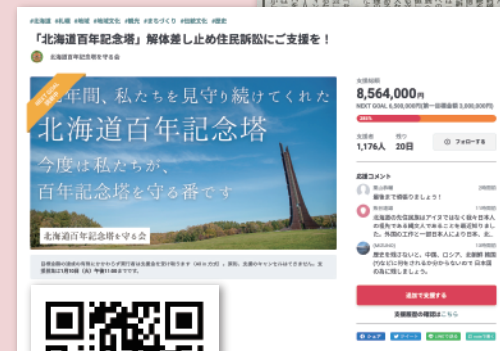
③訴訟費用を確保するために Readyfor で住民訴訟支援プロジェクトを立ちあげた。2カ月余りで全国から850万円余の支援と1176人のメッセージが寄せられた

記念塔保全活動の詳細情報はこちらにアクセス https://readyfor.jp/projects/100nenkinentou