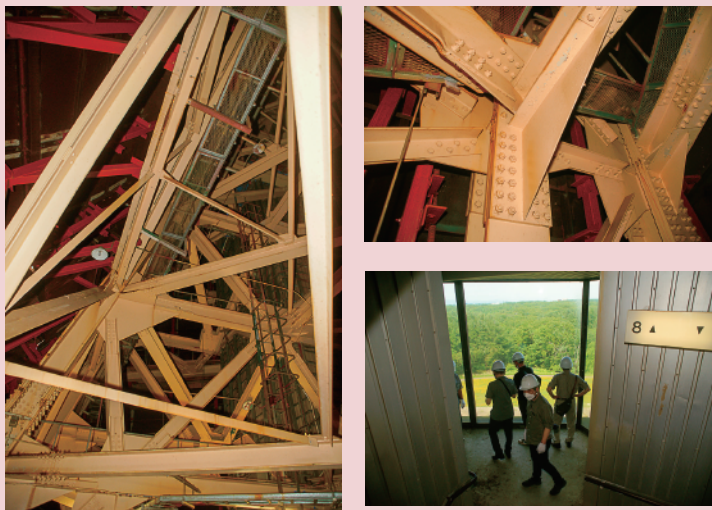
⑫ 建築の専門家グループ「北海道百年記念塔の未来を考える会」の令和4年7月3日内部調査写真。5年以上放置状態であったとは思えないほど塔体は健全で、少しの不安も感じられなかった