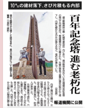
⑧北海道新聞 (R2/06/21)。令和2年6月20日、道はマスコミを招いて落下部材を示し「老朽化」をアピールした

空間構想の41pに解体理由が書かれてありますが、情報公開制度を通してその根拠を求めると「黒塗り」でした。道は説明はしますが、決して根拠を示しません。そもそも百年記念塔は100年耐久を条件に設計されました。令和4年に建築の専門家が行った内部調査でも「問題なし」と判断されています。平成30年に部材が落下して老朽化の根拠とされましたが、これは平成4年に後付けされた部材で、日常の点検を行っていれば防げたものです。道は平成25年頃から塔の維持管理の手を抜き始め、平成29年からは完全に放棄しました。部材の落下は老朽化よりも道の管理責任が問われる事態です。