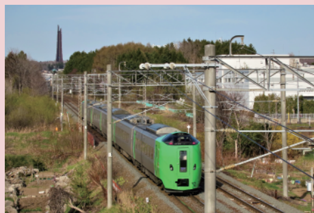
ランドマークとして多くの学校の校章や校歌に用いられ、地域の歴史の一部となってきた