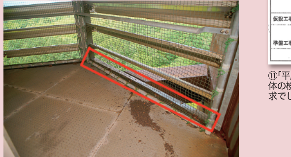
⑨令和4年7月3日「北海道百年記念塔の未来を考える会」内部調査写真。落下したのは赤枠の部材。定期点検で容易にぐらつきを発見できる場所にある