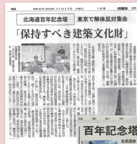
①産経新聞（平成4年11月17日）。東京で本州から記念塔保存を支援する「北海道百年記念塔を支える会」が立ち上がった。この問題は全国問題になっている

北海道は世界でも希な極寒豪雪の地。そこをわずか100年余で欧州にも匹敵する豊かな大地に変えたのは誰でしょうか？ 郷里のために頑張ろうという決意の源は父祖への感謝です。そうした決意の象徴を否定して、どのように地域の振興を図るのでしょうか？ 北海道は10年連続人口減少全国一です。今こそ北海道百年記念塔は守られなければなりません。